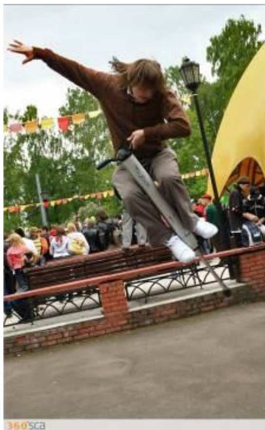
360'sca Агентство спортивных коммуникаций 360SCA