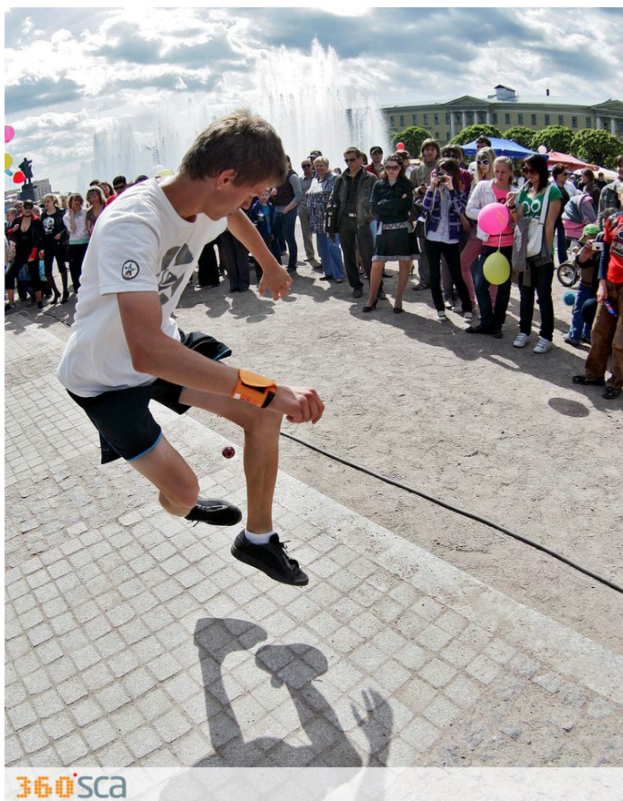
Агентство спортивных коммуникаций 360SCA